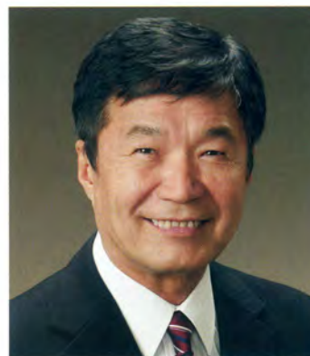
前 衆議院議員 若井やすひこ